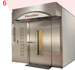
//// Fours à chariot rotatif R10 Rotary rack oven