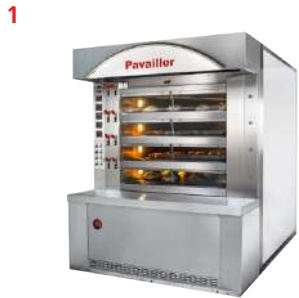
//// Fours Cyclothermes à soles fixes Cyclothermic deck ovens