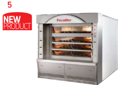
//// Fours bi-énergie à soles EMERAUDE Bi-energy deck ovens