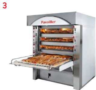
//// Fours compacts électriques à soles SAPHIR , 4 ou 5 étages Electric compact deck oven SAPHIR, 4 or 5 levels

BP 54 - Rue Benoît Frachon - 26802 Portes-les-Valence cedex - France. Tél. + 33 (0) 475 575 500 - Fax + 33 (0) 475 572 319 contact@pavailer.com - www.pavailer.fr