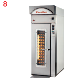
//// Fours électriques à chariot fixe TOPAZE Style-L15 / Electric rack ovens