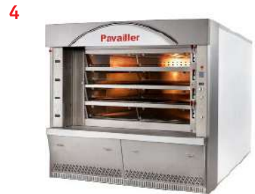
//// Fours vapeur à tubes annulaires JADE 2 Annular tubes Stream ovens