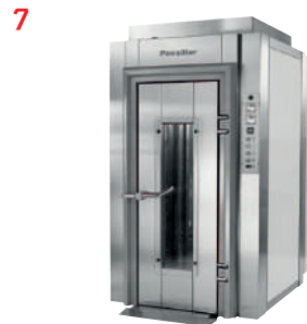
//// Fours à chariot rotatif CRISTAL Rotary rack oven