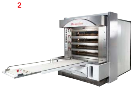
//// Fours électriques à soles OPALE Style Electric deck oven OPALE Style «2 doors»